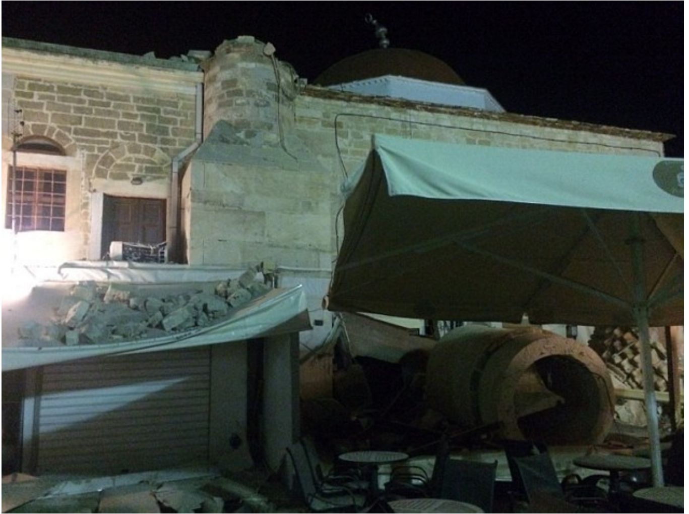
地震使希腊科斯岛上的几座大型修建物坍塌。